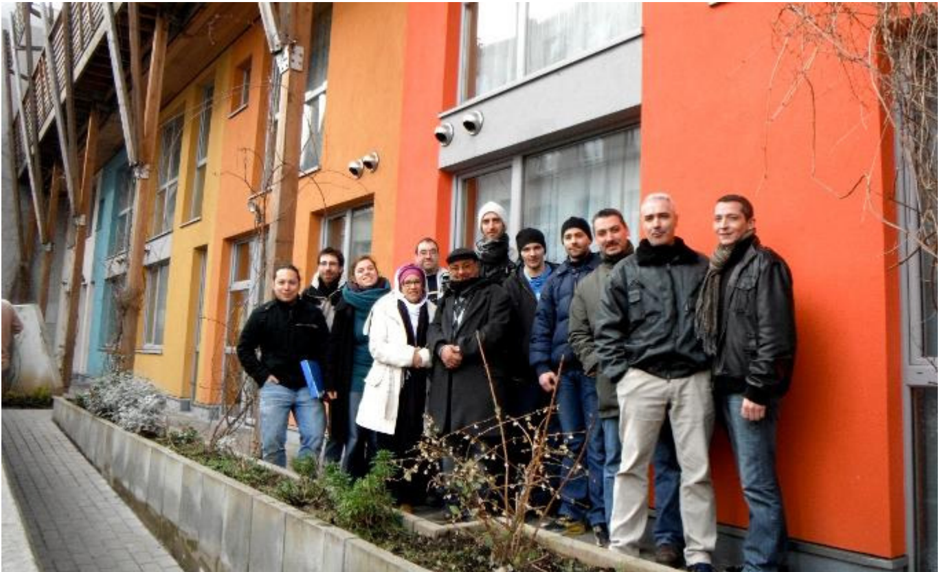
14 kroostrijke gezinnen zijn eigenaar geworden van een passiefwoning

Tegenwoordig weet iedereen dat we de CO 2 uitstoot moeten verminderen als we een leefbare en gezonde wereld willen nalaten aan onze kinderen. De Brusselse politiek heeft alles op alles gezet om dit te verwezenlijken. Vanaf 2015 zullen alle nieuwbouwprojecten aan de passief standaard moeten beantwoorden.