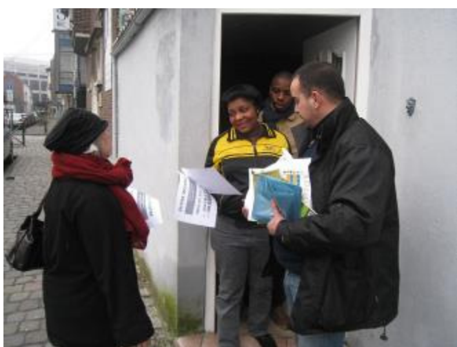
Van deur tot deur affiches en kalender uitdelen

Een aantal bewoners wensten een lenteschoonmaak te organiseren in hun straat en omliggende straten. Buurthuis Bonnevie ondersteunde hen bij de organisatie van deze lenteschoonmaak en vroeg ook de medewerking van de gemeente.