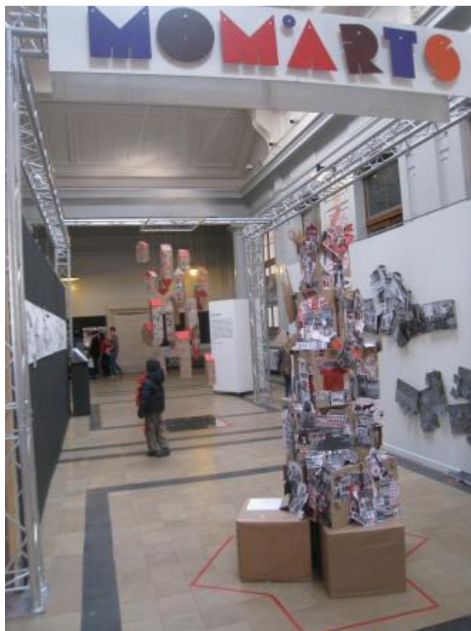
'Stad in verandering': tentoonstelling

woning komt die doorgaans echte energievreters zijn. De komende jaren zullen er steeds meer passiefwoningen gebouwd worden in de gemeente en in het Brussels Hoofdstedelijk Gewest. De gezinnen van Espoir die vandaag experts zijn geworden in het gebruik van hun passiefwoning, zijn zich maar al te goed bewust van het belang van informatie en begeleiding. Met hun goede en hun slechte ervaringen, en hun verhalen hebben ze andere, toekomstige huurders van passiefwoningen gesteund en hen in staat gesteld om hun gedrag aan te passen en op hun beurt te besparen op energie. Sinds de 14 gezinnen van Espoir in 2010 hun passiefwoning betrokken, hielden ze al meer dan 100 keer opendeur. Bezoekers zijn niet alleen nieuwsgierig naar de manier van leven in een passiefwoning, ze willen ook weten hoe de bewoners eigenaar werden en hoe ze evo-